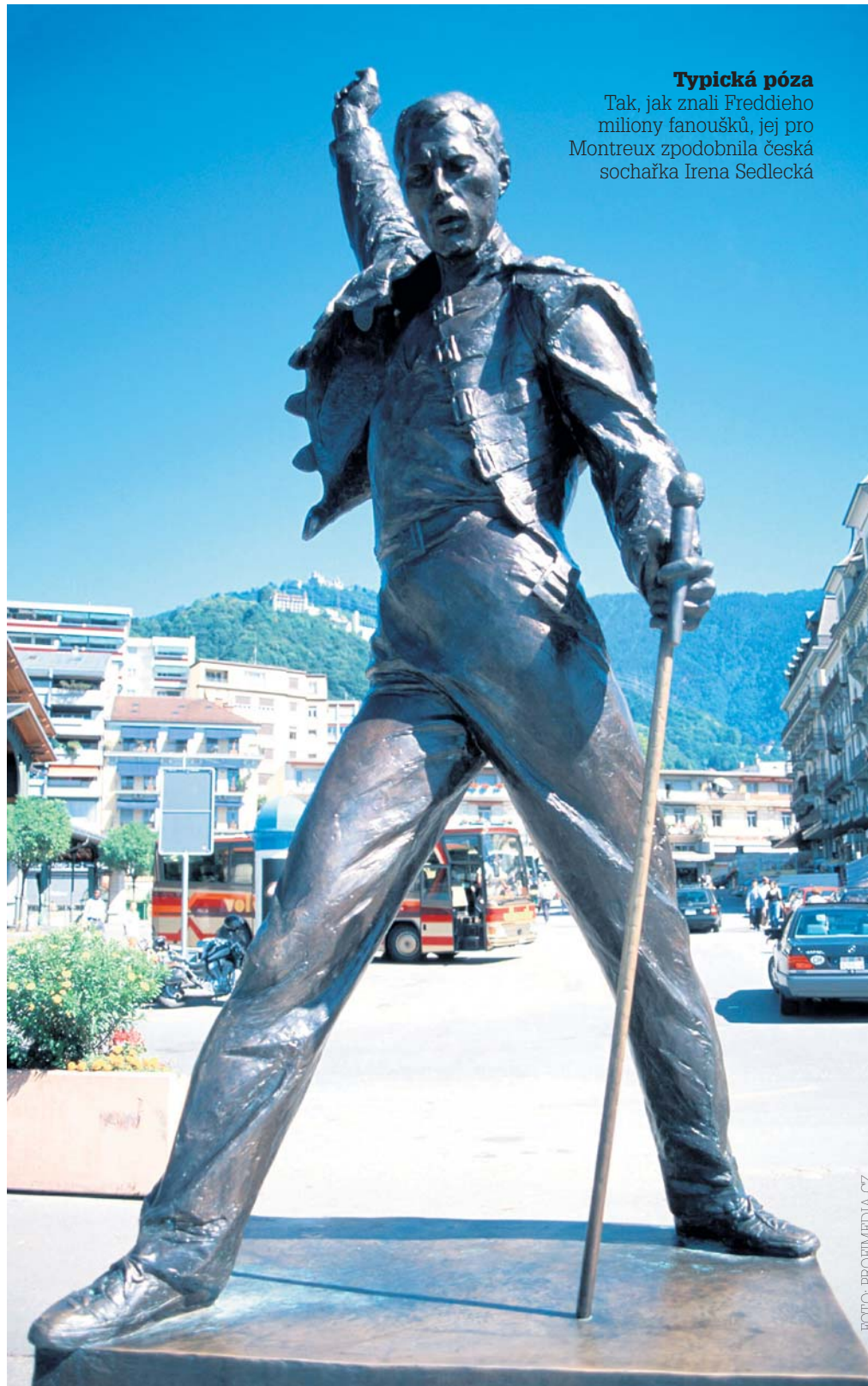
Typická póza Tak, jak znali Freddieho miliony fanoušků, jej pro Montreux zpodobnila česká sochařka Irena Sedlecká

Naopak v jídle Mercury – pro lecko-možná překvapivě – marnivý nebyl. Jestliže nocleh v nejdražším pokoji jeho favorizovaného hotelu