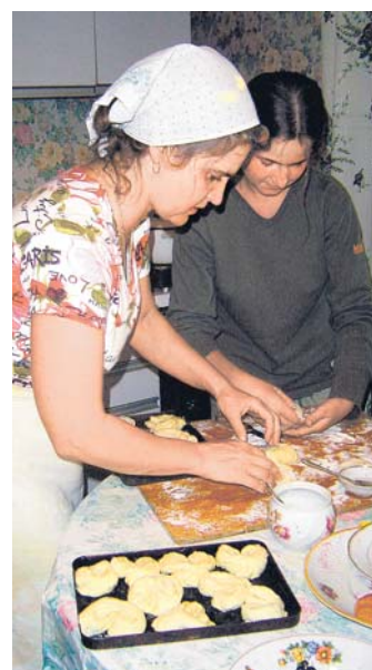
Pljúšky Kromě pirožků se v Rusku pečou i tyto sladké pamlsky ve tvaru srdíček či růží

Důkladně promíchaná hmota se uloží do misky a nechá se půl hodiny v chladu kynout. Pozor, pirožkové těsto přibývá hodně a rychle, pokud nezvolíte dostatečně hlubokou nádobu, těstopád jako z filmové zhruba desetcentimetrové koule. Taťána, která svůj pirožkový receptář prokládá vzpomínkami na to,